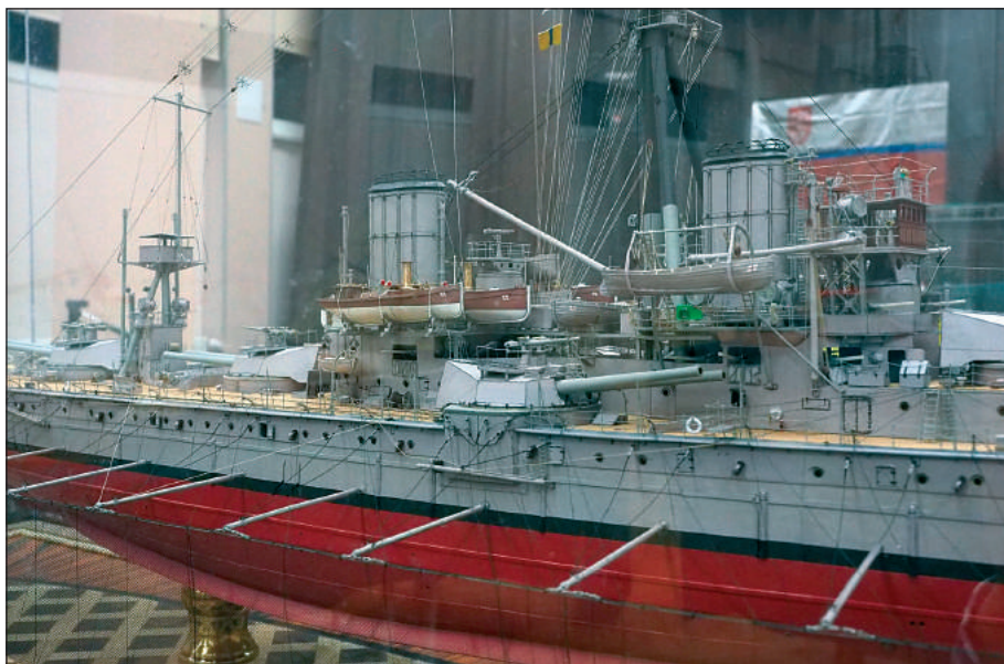
Model brytyjskiego pancernika z okresu I wojny światowej HMS „Dreadnought”. Jego wykonawca Oleksandr Dron (Ukraina) zdobył złoty medal i Puchar Prezesa SM „Zacisze” w Oleśnicy za najlepiej wykonany model kartonowy oraz Grand Prix Mistrzostw – Puchar Prezesa LOK za model najwyższej oceniony. Klasa C-7, skala 1/200, ocena 99,00 pkt.

Liczba modeli i ich rozmiary spowodowały konieczność rozszerzenia wystawy na dwie sale. Dzięki uprzejmości gospodarzy nie było