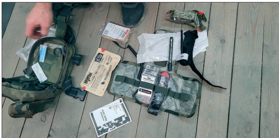
Apteczka i jej zawartość do udzielania pierwszej pomocy przedmedycznej

treningi strzeleckie, które odbywają się na Myślenickiej Strzelnicy Sportowej mają na celu popularyzację kultury fizycznej i sportów obronnych, w tym strzelectwo sportowe dla dzieci i młodzieży.