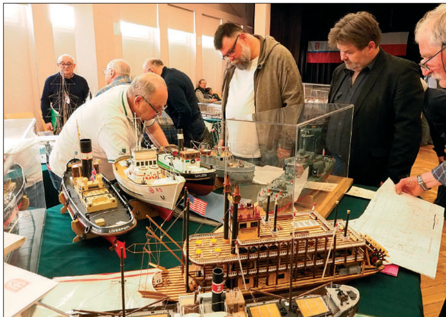
Komisja sędziowska ocenia modele klasy C-2

Klasa C-7 to modele kartonowe i papierowe wykonane z wycinanek, m.in. takich, jak lokowski „Mały Modelarz”. I w tej klasie wykonanie modeli to nie tylko wycięcie i sklejenie modelu, co zresztą często nie jest rzeczą łatwą. Modelarze prześcigają się w pomysłach i sposobach wykonania, aby uzyskać efekt przybliżający wygląd modelu do wyglądu oryginału. Najlepszym dowodem