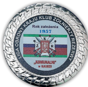
Pamiątkowy medal opracowany i wykonany staraniem Zarządu Klubu

W ramach Rejonowej Organizacji Ligi Obrony Kraju w Kaliszu istnieje i działa Klub Żołnierzy Rezerwy LOK „Komunalni”. Nie byłoby w tym nic nadzwyczajnego, gdyby nie fakt, że ten kaliski Klub działa nieprzerwanie od 17 marca 1957 r. W bieżącym roku obchodzi on zatem piękny jubileusz 65 lat działalności. Dziś wiele faktów z historii jego działalności można poznać z kronik, pieczołowicie prowadzonych od początku istnienia Klubu. Na przestrzeni kilku minionych lat nastąpiła wymiana pokoleń. Stara „Gwardia klubowa”, która od początku tworzyła i rozwijała Klub Oficerów Rezerwy, przekształcony w 2010 r. w Klub Żołnierzy Rezerwy, odeszła już „na wieczną wartę”. Potrafiła jednak znaleźć kolejnych entuzjastów, którzy z powodzeniem kontynuują tradycje klubowe, zapewniając dalszą działalność KZR LOK „Komunalni” w Kaliszu.