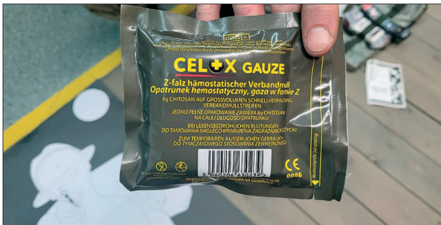
Opatrunek hemostatyczny do udzielania pierwszej pomocy przedmedycznej

W ramach zajęć strzeleckich Koło Myślenice Światowego Związku Żołnierzy Armii Krajowej przygotowało cykl szkoleń z ratownictwa taktycznego – pierwsza pomoc przy postrzałach. Na pierwszych w tym roku zajęciach objaśniono strukturę organizacji pomocy w zależ-