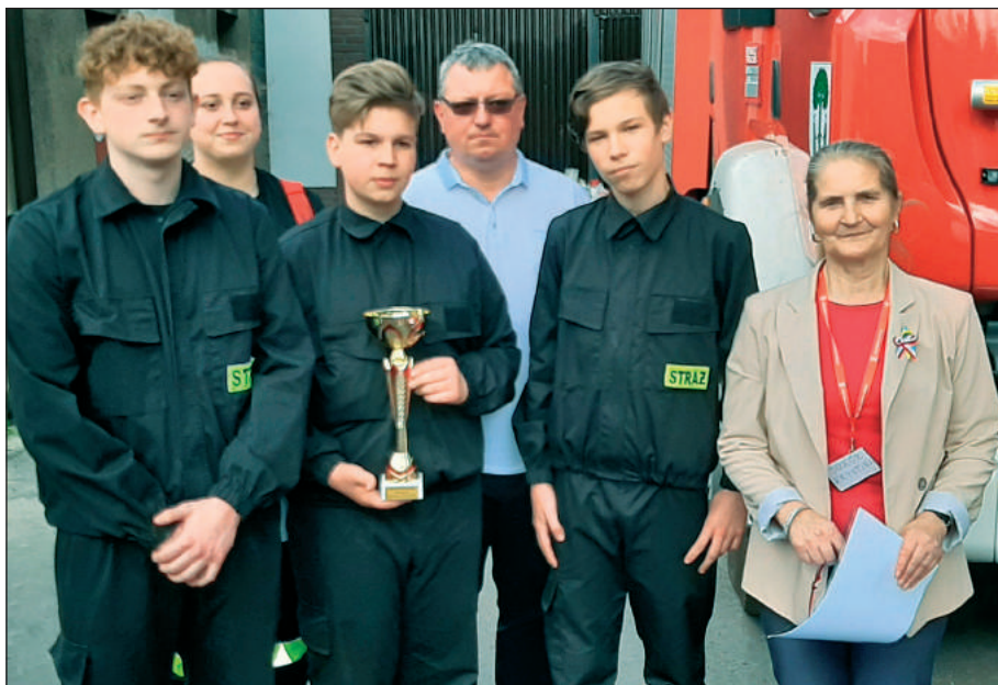
W klasyfikacji drużynowej w konkursie strzeleckim pierwsze miejsce zajęła Młodzieżowa Drużyna Pożarnicza z OSP Byczyna