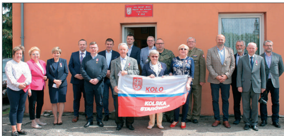
Uczestnicy obchodów 20-lecia Powiatowego Klubu LOK „Kolska Starówka” z flagą przed klubowym budynkiem