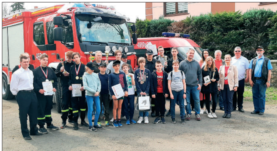
Pamiątkowe zdjęcie uczestników Pikniku Strzeleckiego LOK w Jaworznie