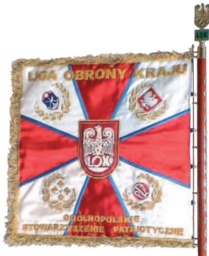
Sztandar Ligi Obrony Kraju

Organizacja nasza, realizując swoje zaszczytne statutowe zadania, na przestrzeni swego 80-letniego istnienia jednoczyła wysiłki swoich członków i sympatyków – najpierw związanych z wyzwoleniem kraju i jego odbudową ze zniszczeń wojennych, a następnie z umacnianiem jego bezpieczeństwa, wzrostem siły obronnej, rozwojem szkolenia, sportów obronnych i politnicznych.