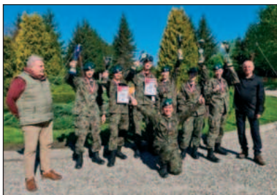
Zwycięska drużyna Podkarpackiej Organizacji Wojewódzkiej LOK