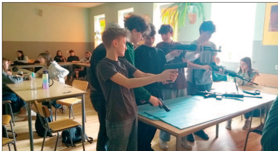
Pokaz broni dla uczniów z II Liceum Ogólnokształcącego