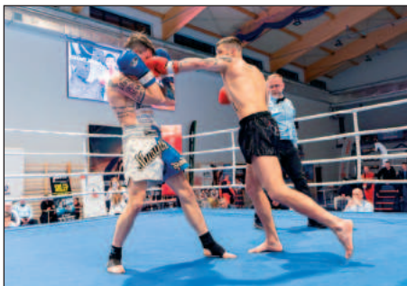
Walki odbywały się przez dwa dni, równocześnie na dwóch ringach