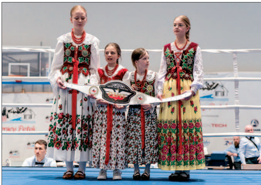
Pas mistrzowski został ufundowany przez Organizację Powiatową LOK w Nowym Targu