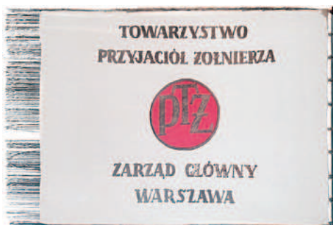
Sztandar Towarzystwa Przyjaciół Żołnierza