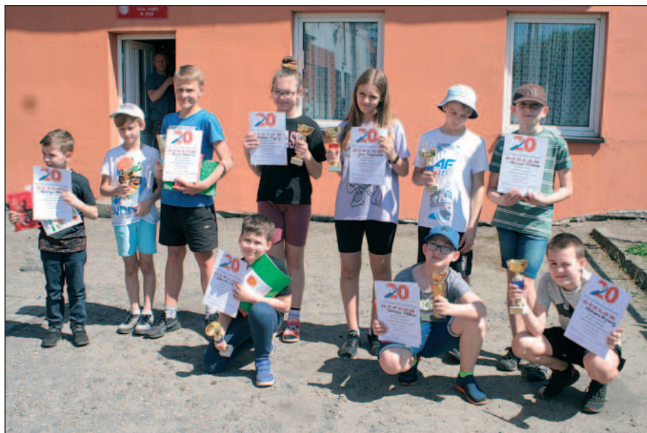
Uczestnicy dwuboju sportowo-obronnego o Puchar Burmistrza Miasta Koła w kategorii dziewcząt i chłopców z pucharami i dyplomami