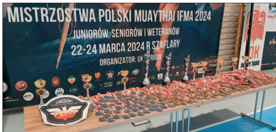
W Mistrzostwach Polski Muaythai IFMA 2024 uczestniczyło ponad 200 zawodników z całej Polski

Osoby niezorientowane w celach statutowych i działaniach Ligi Obrony Kraju może nieco dziwić obecność naszego Stowarzyszenia jako współorganizatora tej imprezy, ponieważ LOK kojarzona jest przede wszystkim ze strzelectwem, modelarstwem, krótkofalarstwem czy sportami wodnymi. Odpowiedź jest bardzo prosta, obronność i sport wyczynowy to pojęcia bardzo szerokie, mieszczące w swoim zakresie zarówno strzelców, jak i „współczesnych gladiatorów” sztuk walki. Do uprawiania sportów obronnych i wyczynowych na wysokim poziomie konieczna jest taka sama wola walki, upór i dyscyplina, a także długie godziny treningów.