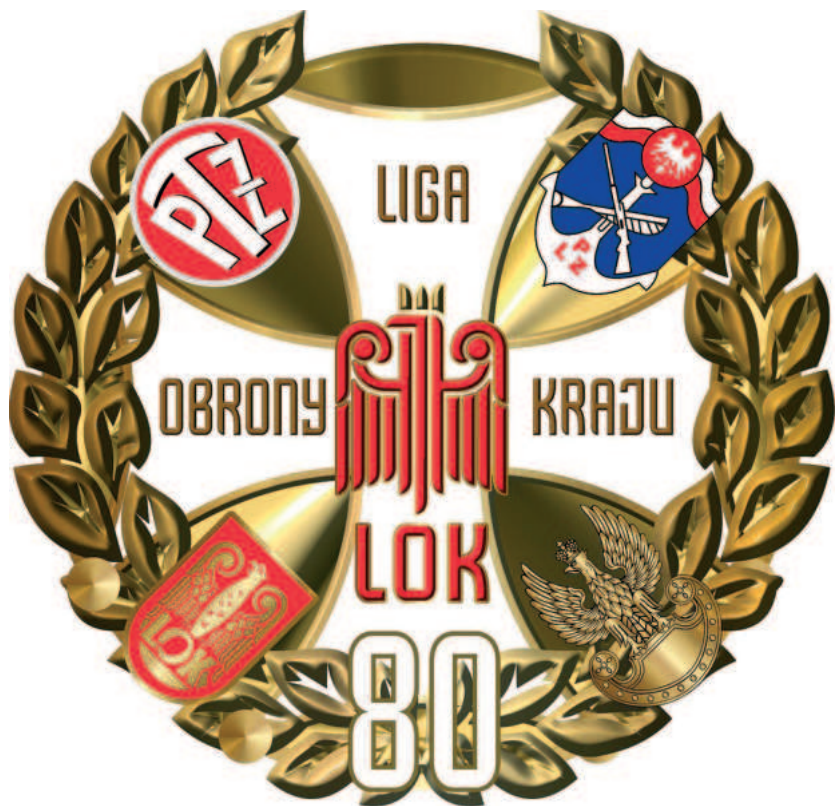
Medal 80-lecia Ligi Obrony Kraju „Za Zasługi”