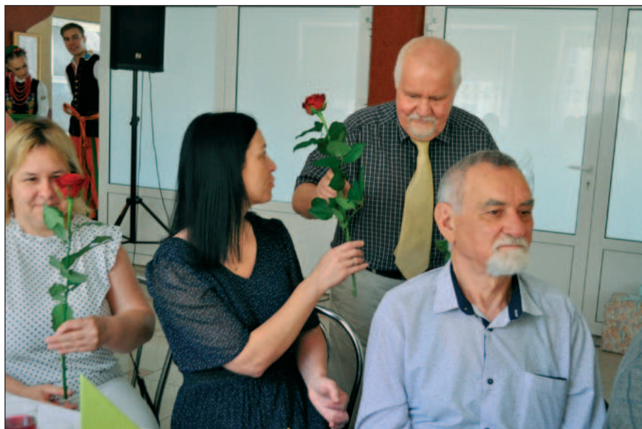
Z okazji „Dnia Matki” wszystkie panie uczestniczące w uroczystości jubileuszu Klubu „Kolska Starówka” obdarowane zostały różami