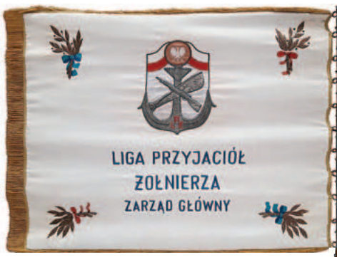
Sztandar Ligi Przyjaciół Żołnierza

Zapoczątkowanie dążenia do rozwijania społecznej działalności oficerów rezerwy wystąpiło na przełomie lat 1956–1957. Wtedy to oficerowie rezerwy zwolnieni z zawodowej służby wojskowej w ramach częściowej redukcji Sił Zbrojnych zaczęli tworzyć terenowe Koła Oficerów Rezerwy przy Wojskowych Komendach Rejonowych. Praktyka wykazała jednak, że Koła Oficerów Rezerwy mogą się rozwijać i aktywnie działać tylko w warunkach posiadania szerokiego zaplecza społecznego i sprzętowego. Dlatego w 1960 r. postanowiono decyzją MON włączyć istniejące koła do Ligi Przyjaciół Żołnierza, która stosownie do swej struktury organizacyjnej przekształciła je w Kluby Oficerów Rezerwy LPŻ, posiadające szerokie możliwości angażowania oficerów rezerwy do społecznej działalności obronnej.