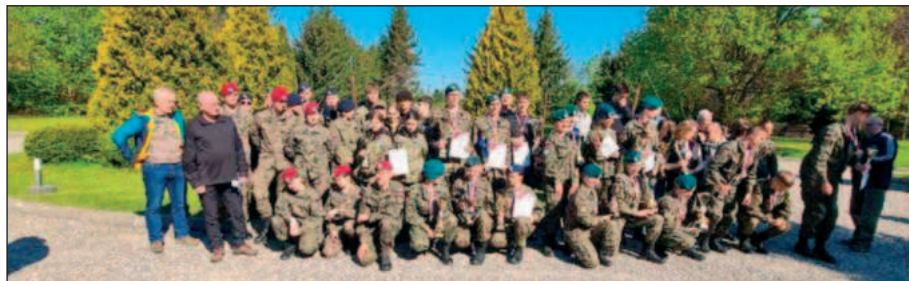
Pamiętkowe zdjęcie uczestników zawodów po ich zakończeniu